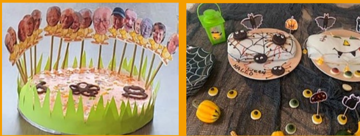
Gefeliciteerd Parklaan 5-7 en Vijverhof 6-8!